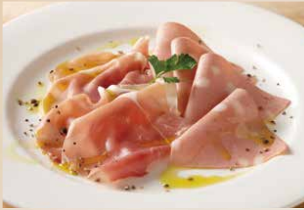
生ハム&モルタデッラ盛り合わせ Assorted Italian Dry Cured Ham & Mortadella 1,140 (税込1,254)