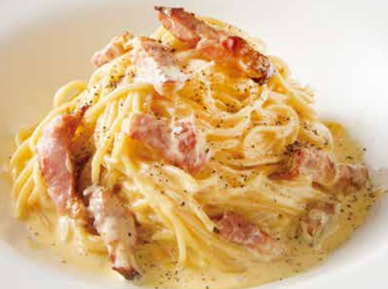
黒豚パンチェッタのカルボナーラ 1,990 (税込2,189) Carbonara Spaghetti with Black Pork Pancetta