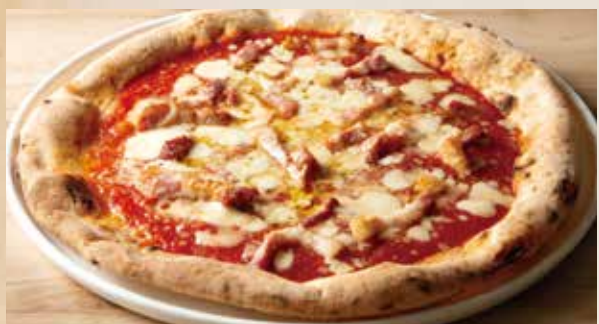
パンチェッタ 2,040 (税込2,244) Pancetta (トマトソース・モッツアレラ・パンチェッタ)