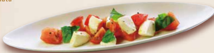
カプレーゼ 990 (税込1,089) Caprese