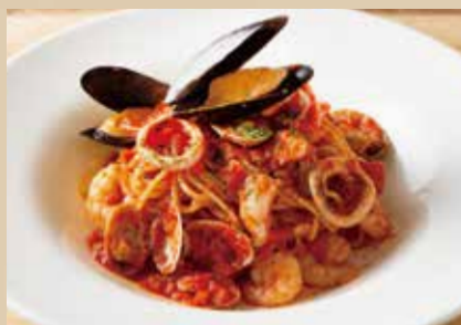
魚介のペスカトーレ Pescatore Spaghetti 1,790 (税込1,969)