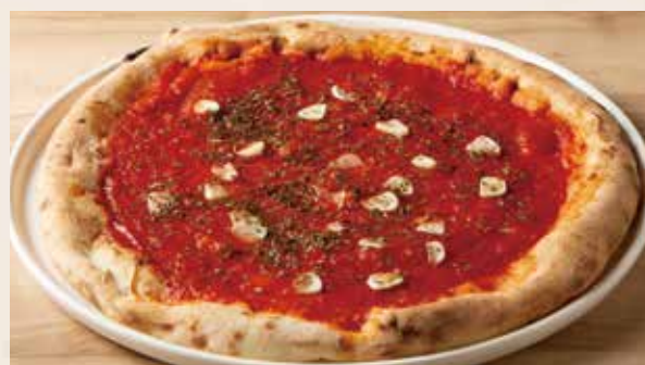
マリナーラ 1,390 (税込1,529) Marinara (トマトソース・ニンニク・オレガノ)