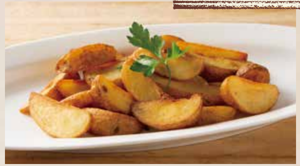
アンチョビガーリックフライドポテト French Fries with Anchovy Garlic Flaver 790 (税込869)