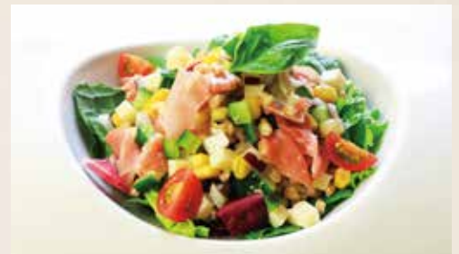
生ハムとペコリーノチーズ、ファッコの イタリアンサラダ Chopped Salad (Italian Dry Cured Ham, Pecorino Cheese, Farro, etc) 1,290 (税込1,419)