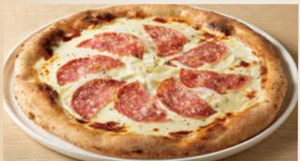
ミラノサラミ&オニオン 1,790 (税込1,969) Milano Salami & Onion (ミラノサラミ・オニオン・モッツアレラ)