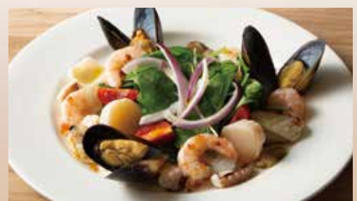
サラダほうれん草と魚介のマリネサラダ Salad Spinach & Marinated Seafood Salad 1,390 (税込1,529)