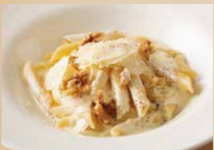
ゴルゴンゾーラチーズクリームのペネ Cream Sauce Penne with Gorgonzola Cheese 1,590 (税込1,749)