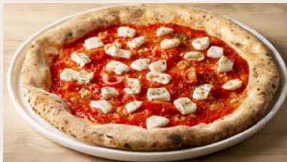
ミニトマトとカラマリのアンチョビガーリック 1,590 (税込1,749) Anchovy Garlic Pizza with Cherry Tomatoes & Calamari (トマトソース・イカのマリネ・ミニトマト)