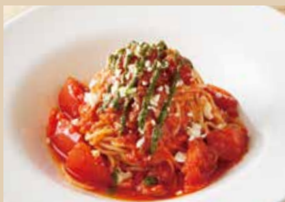
モッツアレラポモドーロ Pomodoro Spaghetti with Mozzarella Cheese 1,490 (税込1,639)