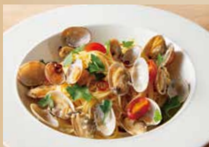
ボンゴレビアンコ Vongole Bianco Spaghetti 1,690 (税込1,859)