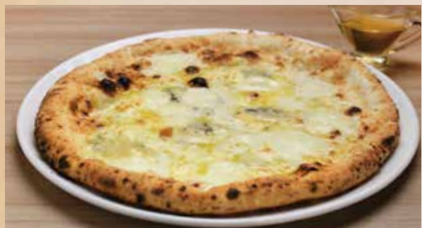
クアトロフォルマッジ 2,440 (税込2,684) Quattro Formaggi (4種のチーズ)