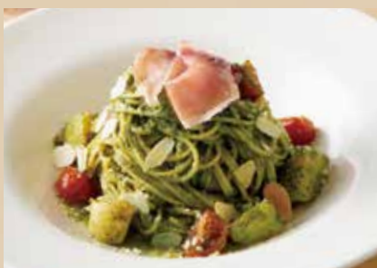
生ハムとじゃが芋のジェノベーゼ Genovese Spaghetti with Italian Dry Cured Ham & Potatoes 1,690 (税込1,859)