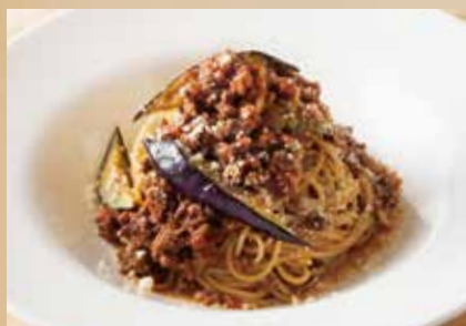
たっぷり牛肉と茄子、 ポルチーニのボロネーゼ Bolognese Spaghetti with Beef, Eggplant & Porcini 1,790 (税込1,969)