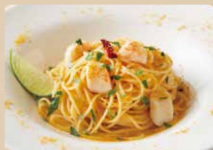
帆立とイタリア産からすみ ライム添え Oil Sauce Spaghetti with Scallop, Dried Mullet Roe & Lime 1,690 (税込1,859)