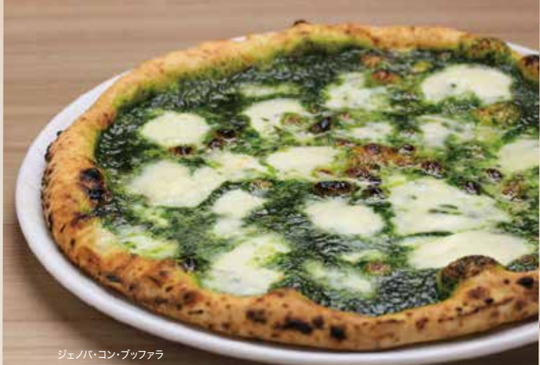
ジェノバ・コン・ブッフアラ