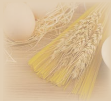
パスタ大盛り 600 (税込660)