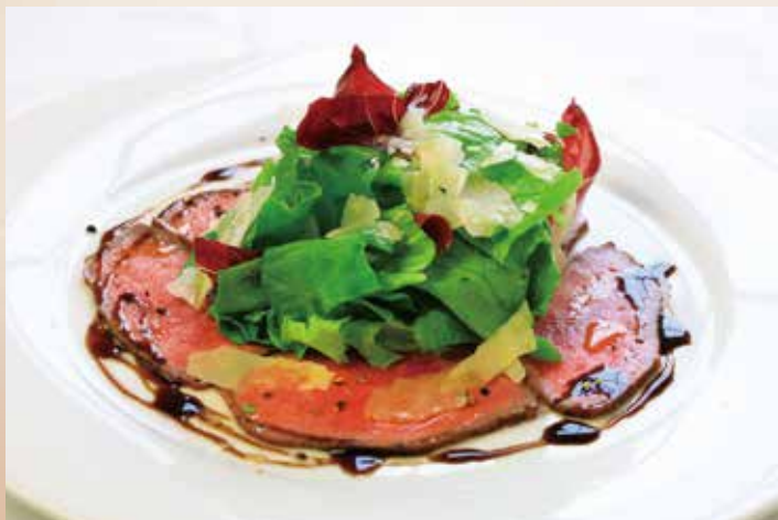
牛もも肉のカルパッチョ風サラダ Beef Carpaccio with Salad 1,390 (税込1,529)