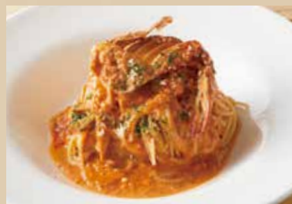
渡り蟹のトマトクリーム Tomato Cream Sauce Spaghetti with Blue Crab 1,690 (税込1,859)