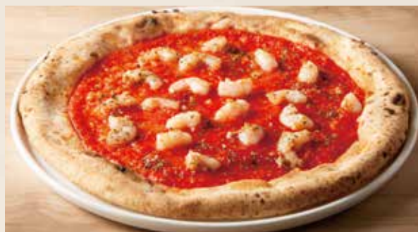
ガーリックシュリンプ (ピカンテ) 1,590 (税込1,749) Garlic Shrimp (Picante) (トマトソース・ガーリックシュリンプ)