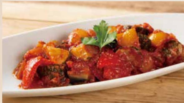
カポナータ 890 (税込979) Caponata